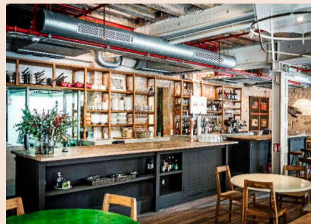
Isla Tortuga ha abierto este año en la calle Llauder de Barcelona.